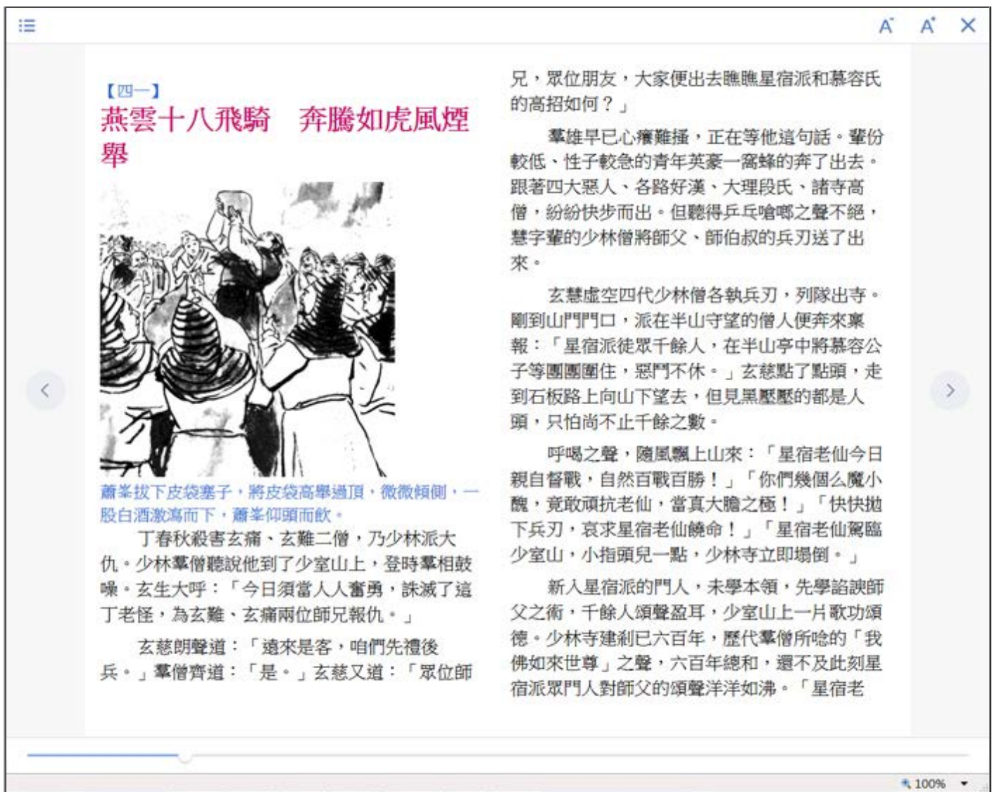
例 3 : Udn 讀書館