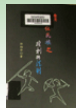
臺灣原住民族 之權利與法制