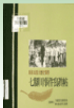
原住民重 大歷史事件