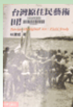
臺灣原住民 藝術田野筆記