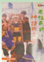
原住民的 神話與文學